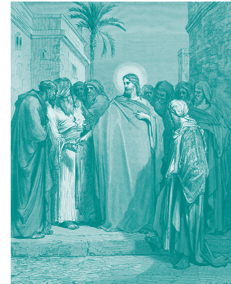
Le denier de César La Sainte Bible selon la Vulgate. Traduction nouvelle par Jean-Jacques Bourassé et Pierre-Désiré Janvier avec les dessins de Gustave Doré - 1866. Bibliothèque du Patrimoine de l'UCL