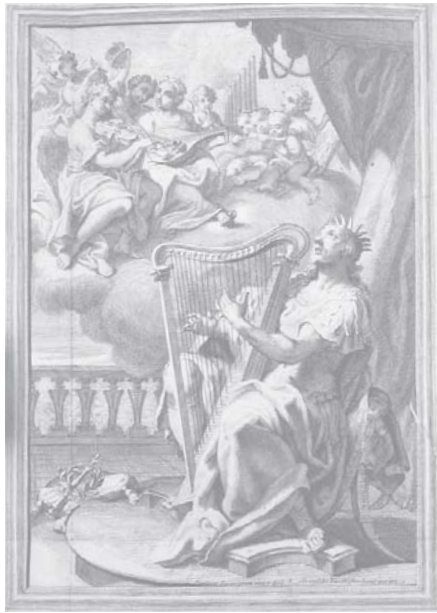
Gabinetto Armonico, pieno d'istromenti sonori indicati e spiegati dal padre Filippo Bonanni de la Compagnia di Giesu offerto al santo re David. - in Roma : Giorgio Placho, 1722. - in-4 (Bibliothèque du Patrimoine, Réserve)